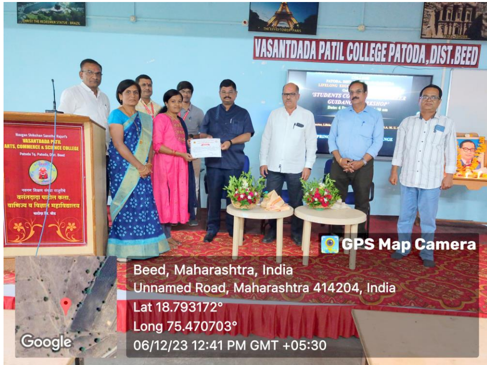
Certificate Distribution of Certificate Course in Beauty Nourishment & Personality Development run under the Cell